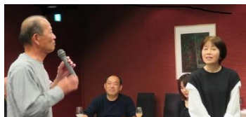
妻への愛を語り掛ける中田君。技を盗もうとする会長(奥)