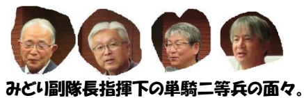
みどい副隊長指揮下の単騎二等兵の面々。