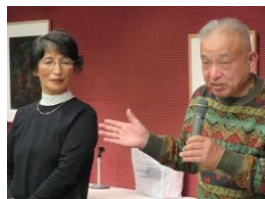
酔う前にしっかり紹介しなきゃ(汗)