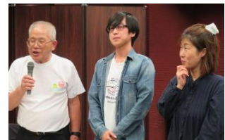
自慢の孫です！自慢のおじいちゃんです！