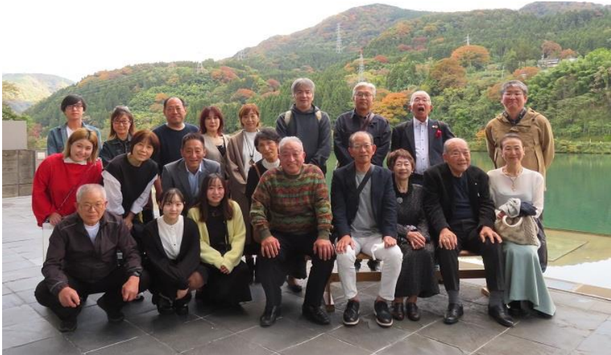
◇神通峡を背景に参加者全員で記念撮影。