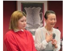
カワイイ、カワイイお嫁ちゃん♥