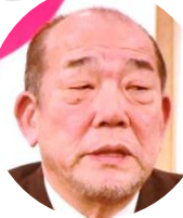
平崎会 長はあい さつで、 会員、元 会員が相 次ぎ亡くなり、3・11も 近いことから、人の命に ついて考えざるを得な かったと切り出されまし た。震災とともにコミュ ニティが壊され、仮設暮 らしを余儀なくされ、孤 独死を招くと指摘。「今 後も命を考える機会とし たい」。

次ぎ亡くなり、3・11も近いことから、人の命について考えざるを得なかったと切り出されました。震災とともにコミュニティが壊され、仮設暮らしを余儀なくされ、孤独死を招くと指摘。「今後も命を考える機会として