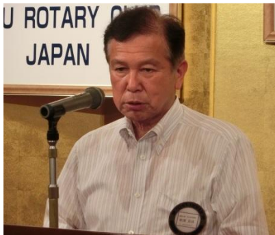
野澤国際奉仕常任委員長

8月2日午後6時30分から「アタゴ美建工業」駐車場で花火観賞会を実施する。多数の参加をお願いしたい。