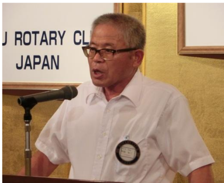
稲盛地域環境委員長