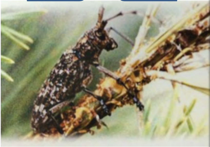
写真(上)は松枯れの原因ともなるカミキリムシと薬剤散布の様子(下)