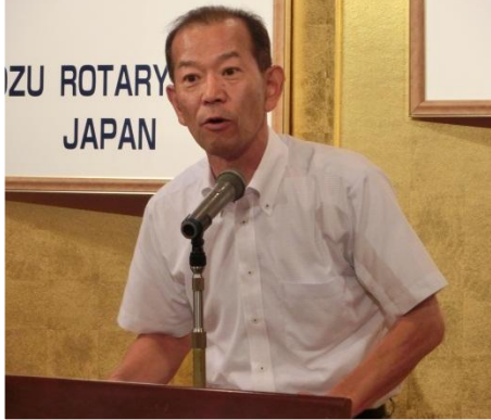
中田親睦活動委員長

8月2日午後6時30分から「アタゴ美建工業」駐車場で花火観賞会を実施する。多数の参加をお願いしたい。