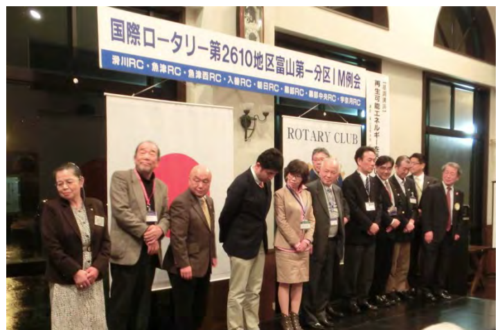
次期、会長、幹事紹介