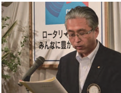
ロータリー友情交換委員会 愛宕委員長

今年度、訪韓年度なので、多くの参加をお願いしたい。2015年に魚津ロータリー創立60周年に釜山釜一クラブを魚津市に迎える予定ですので協力をお願いします。